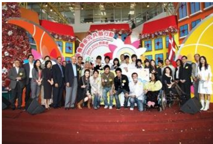
「平等機會多元共融行動」啟動禮暨「十週年紀念特刊：奮進平等路」新書發佈會