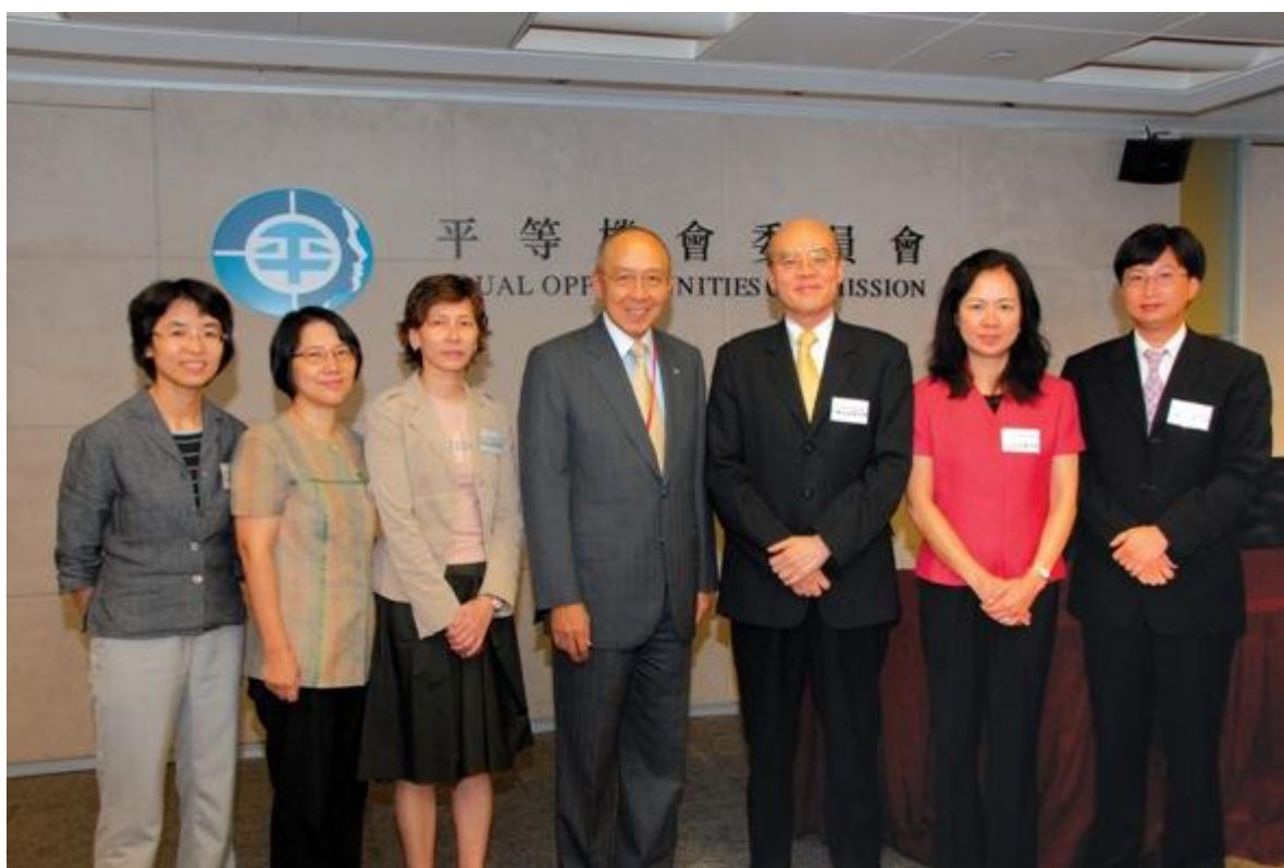
在專注力缺乏/過度活躍症及特殊學習障礙講座上，專家分享他們的見解和資訊。

何謂專注力缺乏/過度活躍症及特殊學習障礙？這類醫學名詞令不少家長和教育家困惑不已。為嘗試提供答案和尋求解決方法，平等機會委員會（平機會）於 2007 年 10 月 8 日為教師、社工、家長及平等機會之友會會員舉辦講座，邀請了在這方面具領導地位的專家講解上述情況和介紹香港現有的支援網絡。