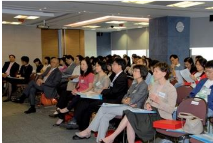
研討會吸引了超過百名平等機會之友會會員參加，他們就如何有效支援精神健康有問題的員工交換意見。

這名幼稚園老師向平機會提出投訴，指她的僱主基於她的殘疾歧視她。當她的病假結束後，她的僱主要求她遞交醫生信，證明她有能力工作才可復工。她依從了僱主的要求，但復工後卻被安排處理文職而非教務工作。幼稚園告訴她，由於不能確定投訴人何時可以復工，所以已聘請別人代替她的職務。幼稚園解釋，他們是出於好意才不與投訴人續約。他們認為，她或許已沒有處理教務工作的能力，而且僱主有權不與員工續約。