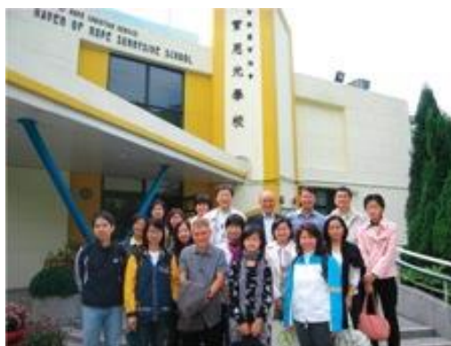
平機會職員及家人探訪靈實恩光學校的殘疾學生。我們又參加了靈實協會的耆樂餅義賣活動，為長者服務籌款。